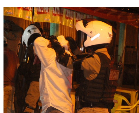
Dezenas de pessoas foram revistas durante a AIFU em Ivaté, que buscou ainda confirmar denúncias de tráfico de drogas e perturbação do sossego

operação foi averiguar denúncias de perturbação de sossego e tráfico de en-