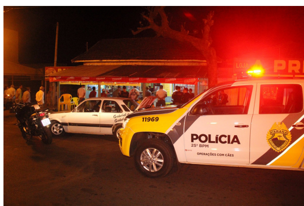
A fiscalização aconteceu em bares e lanchonetes nas proximidades da praça da Igreja, em Ivaté

No total foram oito estabelecimentos vistoriados. O motivo das interdições são irregularidades administrativas. A ação é realizada pela Polícia Militar (RPA de Ivaté, Rocam e Canil), Conselho Tutelar, Vigilância Sanitária e setores de Fiscalização de Alvará e