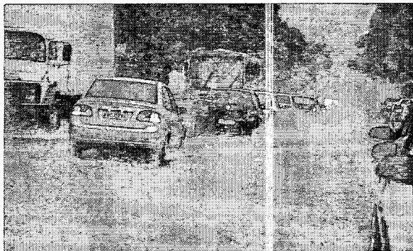
O acumulado de chuva deste ano na cidade é de 953 milímetros