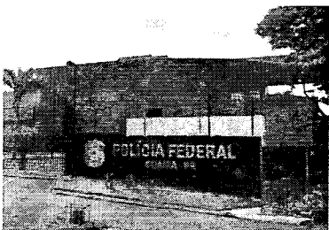
▶ Inauguração oficial ainda não tem data marcada

A moderna edificação possui dois andares que abrigará diversos setores, amplo estacionamento para veículos oficiais e também para visitantes e foi equipada ainda com elevador e mecanismos de acessibilidade.