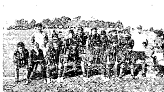
Copinha. Escolas de futebol participam do torneio.

» Na categoria Sub-13, as semifinais começarão às 9h10,