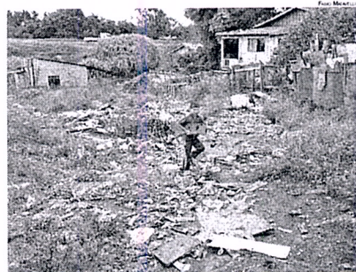
Crianças costumam brincar no local em que o lixo é depositado

O Corpo de Bombeiros conta que as demais casas noturnas que precisam fazer adequações fizeram um Termo de Ajustamento de Conduta, solicitando um prazo maior para as melhorias. "É um período que compreende de 30 a 90 dias. Nesse tempo, elas podem funcionar, mas com o mínimo de segurança. Os outros clubes ainda não se manifestaram", diz a assessoria.