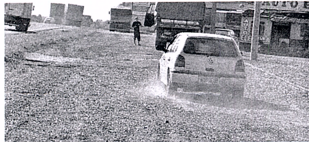
Condutores sentem dificuldades ao passar pela via que dá acesso à BR-376

"Precisa-se de uma estrutura de segurança e agilidade para os moradores destas