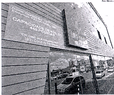
Estabelecimentos precisam informar capacidade máxima