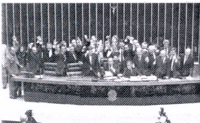
Além do TRF, que abrigará o Fome, deputados federais aprovaram zootecnia e criação de outros três TRFs no País