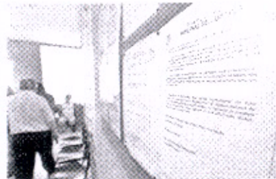
Regulamentação sobre a união deve estar fixada nos cartórios do Estado

"A finalidade da instrução é evitar situações conflitantes,