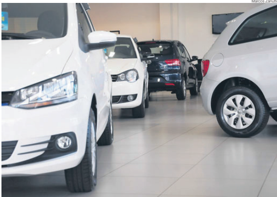
No Paraná, foram 23,5 mil unidades vendidas em novembro e 22,6 mil no mês anterior: crescimento

*Inclui caminhões, ônibus, motos, implementos rodoviários e outros